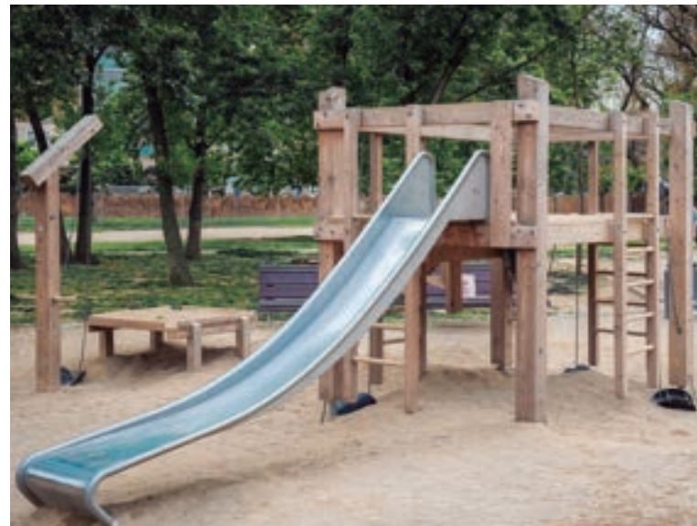
Jugar con arena

Referente mundial en el sector de los juegos infantiles