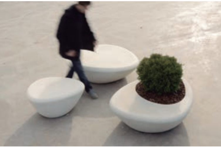
Dinamismo, calidad y versatilidad

Ofrece una amplia colección de mobiliario urbano y de exterior con elementos de diferentes materiales, dimensión y morfología. La elegancia al servicio de los espacios públicos.