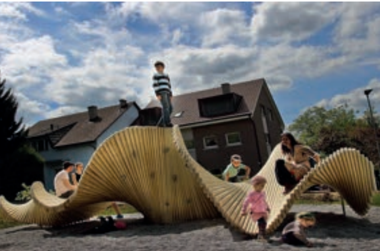
Madera Accoya 100% orgánica y sostenible

Las obras de arte singulares y únicas de MoveArt son elementos multifuncionales que dejan huella en los lugares. Si bien son hermosos a la vista, funcionan como mobiliario urbano y estructura de juego.