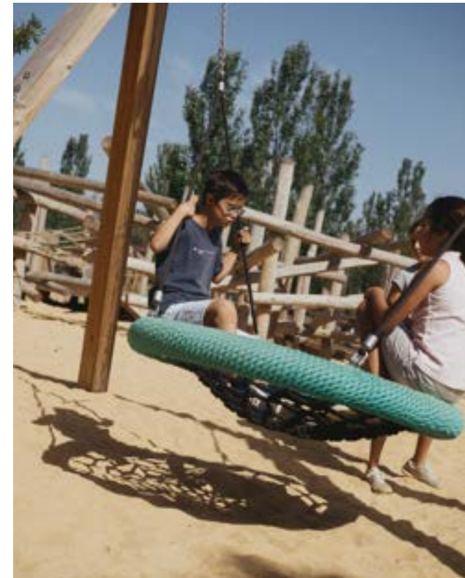
Inclusividad y jugar sin barreras