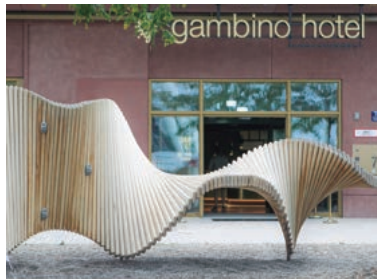
Únicas y multifuncionales